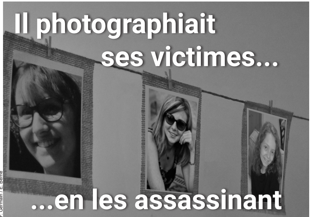
F. Germain / E. Berne

EURO : l'Ukraine affronte la France à 18h00 p.16